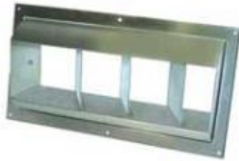
Stainless Steel Drum Louver