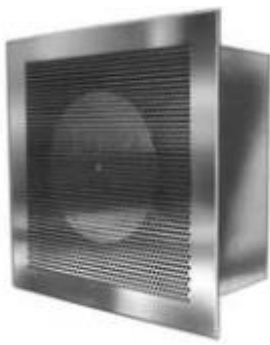
Stainless Steel Perforated Diffuser