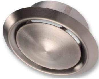
STAINLESS STEEL VALVES