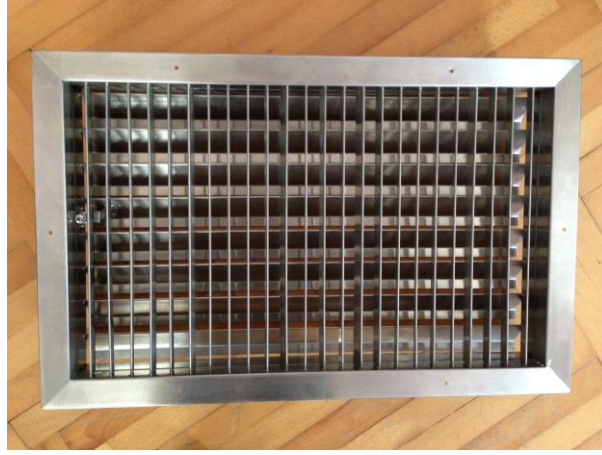
STAINLESS STEEL GRILLES