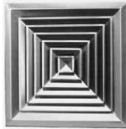
STAINLESS STEEL SQUARE CEILING DIFFUSERS