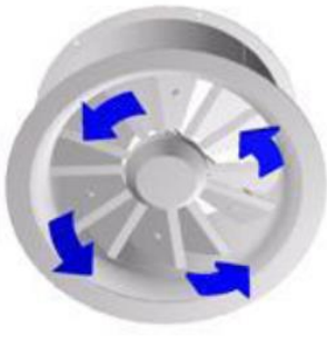
Yatay Pozisyon (Soğutma)